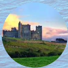
ROCK OF CASHEL